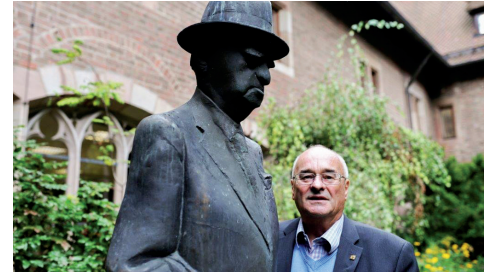
Am Hermann-Kesten-Denkmal vor dem Hermann-Kesten-Zeitungscafé Buchfranken Bd. 13 „Mit schüchternem Stolz und spätem Vergnügen“