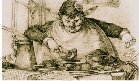
„Die bescheidene Mahlzeit“, Karikatur (1849) Buchfranken Bd. 6 „Lukullus in Franken“